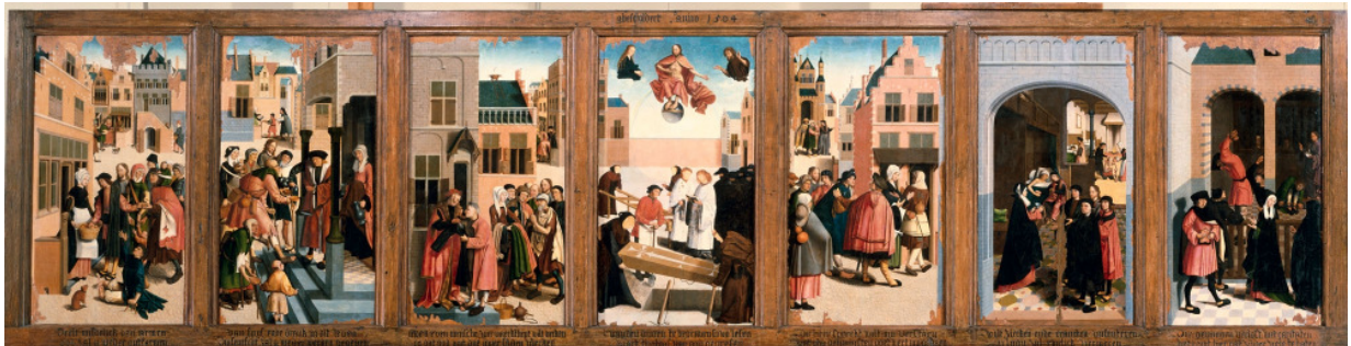
Meester van Alkmaar: "Zeven werken van barmhartigheid".

In wezen worden deze uitdagingen ingevuld door de werken van barmhartigheid en gerechtigheid zoals die in voorgaande jaarverslagen gepresenteerd zijn.